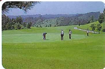
ゴルフ場(浜岡・相良)