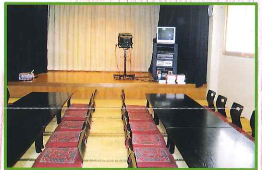
▲1F 和室 兼 大広間