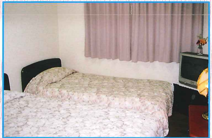
▶2F 洋室 (バス・トイレ完備)