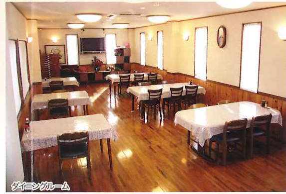
ダイニングルーム