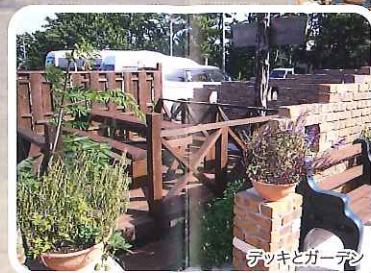
デッキとガーデン