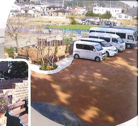
2Fの窓から見える街並み