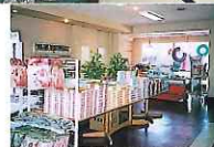
みやげもの・まあめーど