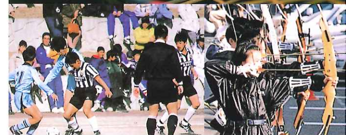
地元にはスポーツ施設が充実しており、テニス・サッカー・野球・陸上・アーチェリー・グラウンドゴルフ・サイクリング… たくさんの施設がございます。ご予約の際にお申し付けください。

牧之原とその周辺には「見る」・「遊ぶ」・「体験する」・「癒す」の4カテゴリーが1年中充実。あなたの満足度を100%にしてくれます。