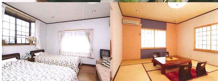
旅の思い出作りは「お部屋」から。快適なベッドは、いつでもフカフカ。