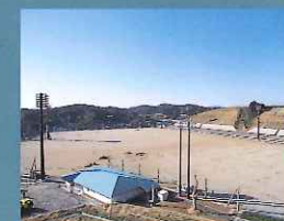
榛原総合運動公園ぐりんばる