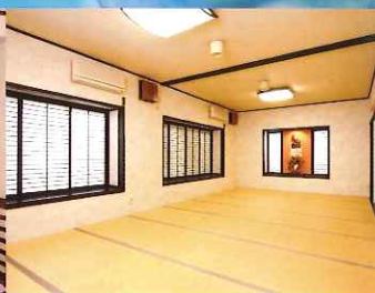
宴会・ミーティングにもご利用いただける多目的ルーム