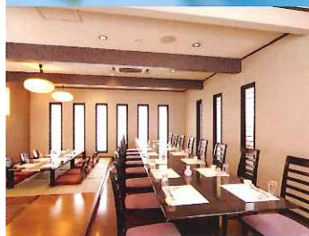
35名食事可能のダイニングルーム

和・洋風の落ち着いた空間をどうぞ。 朝・夕食は黒が基調の洋風ダイニングで。 団体様のご宴会ならやっぱり和室。 楽しいひと時を 地元の味覚でお楽しみください。