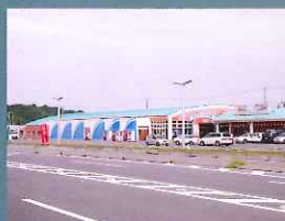
御前崎なぶら市場