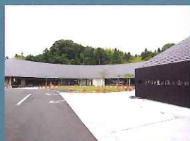
相良子生まれ温泉