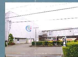
グリンピア牧之原