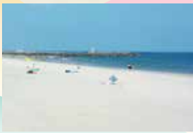
さがらサンビーチ